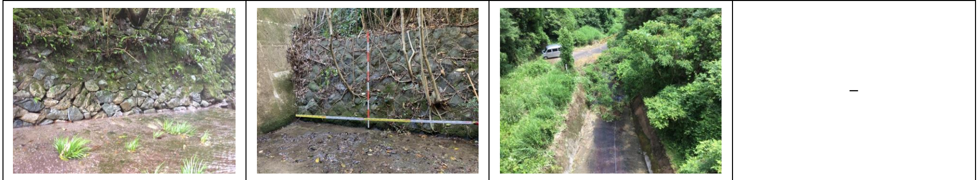
b (損傷あるが、機能・性能低下に至っていない)